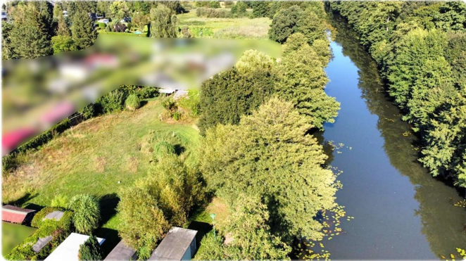
Baugrundstück am Finowkanal