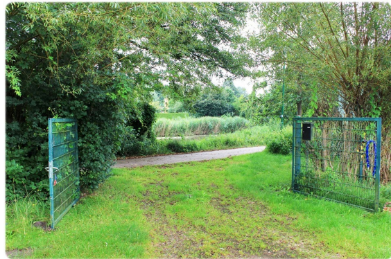
Zufahrt zum Grundstück