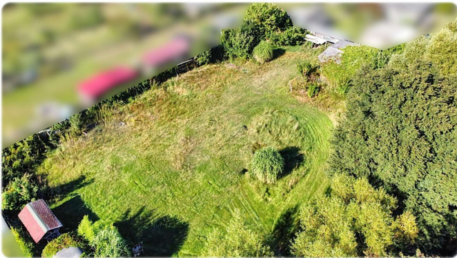
Grundstück Ansicht I