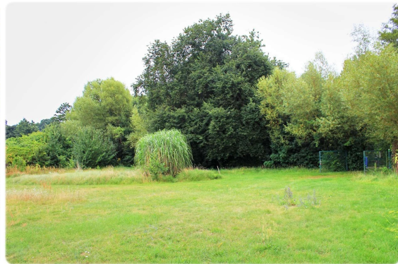
Grundstück Ansicht IV