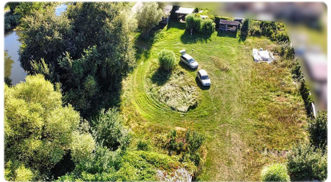
Grundstück Ansicht II