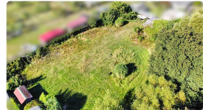
Grundstück Ansicht I