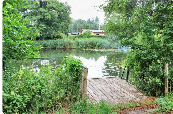
Steg am Finowkanal