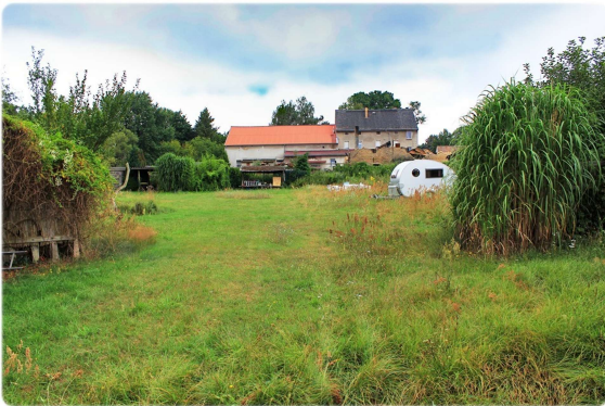
Grundstück Ansicht VI