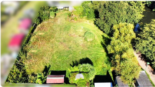
Grundstück Ansicht III