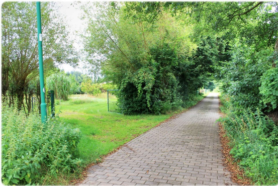
Blick auf die Strasse