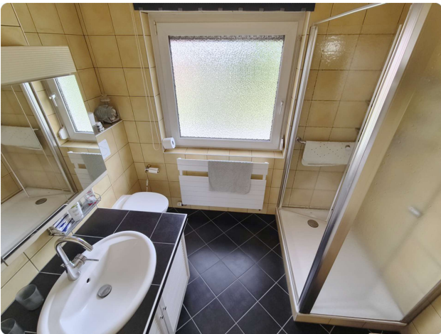
OG - Bad