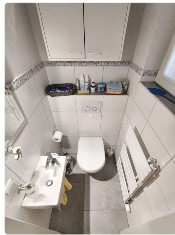
EG - WC