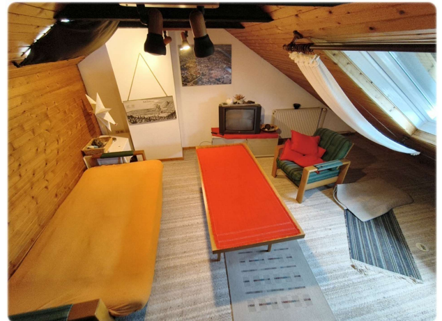
DG - Zimmer