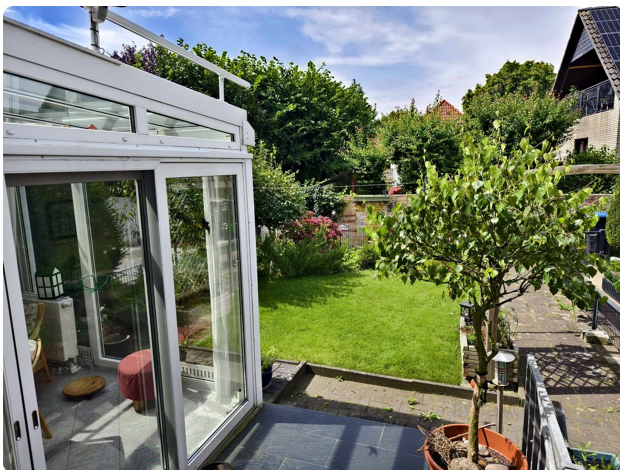
Blick in den Garten