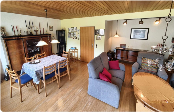
EG - Wohnen II