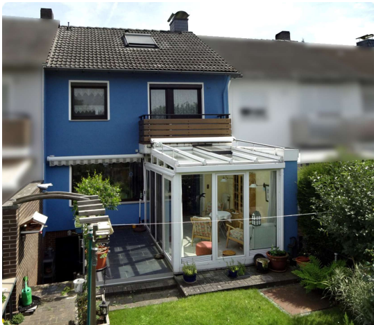
Ihr neues Zuhause