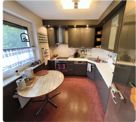
EG - Küche