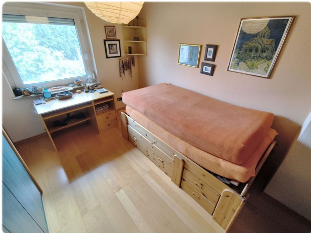
OG - Zimmer 1