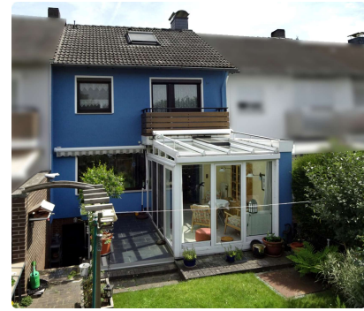
Ihr neues Zuhause