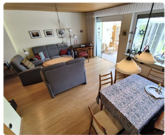
EG - Wohnen I