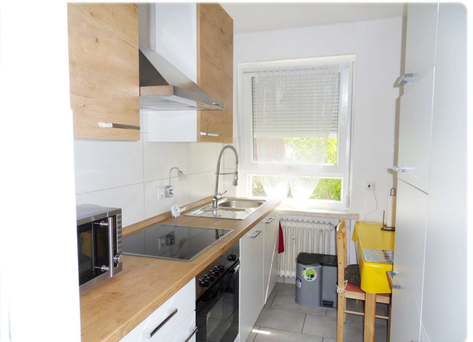
Küche mit EBK