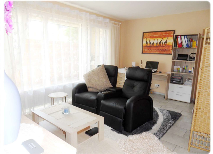
Wohnen und schlafen