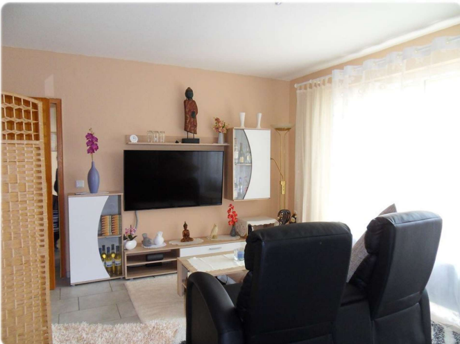
Wohnen und schlafen