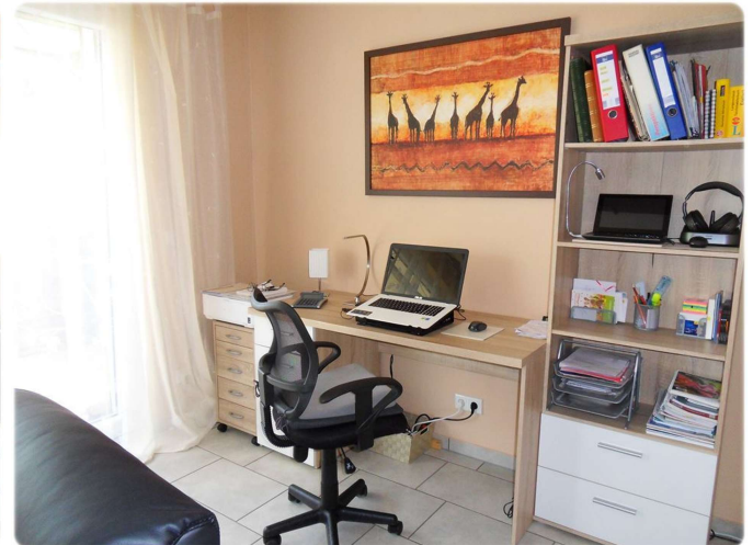
Wohnen und schlafen