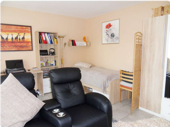
Wohnen und schlafen