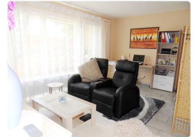
Wohnen und schlafen