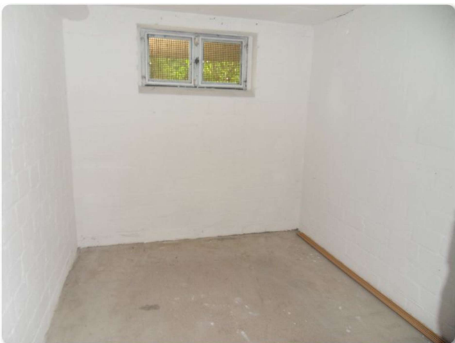
Keller - Beispiel