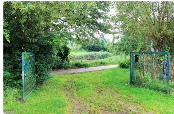
Zufahrt zum Grundstück