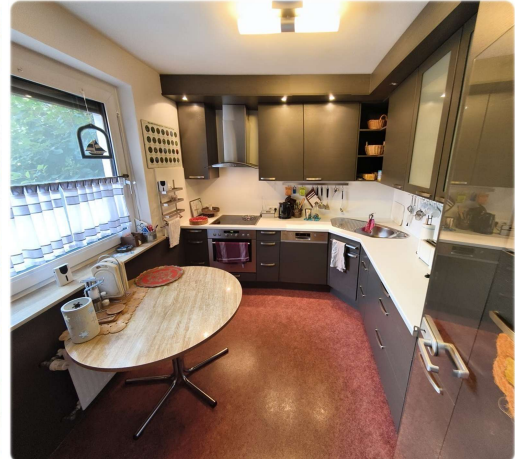
EG - Küche